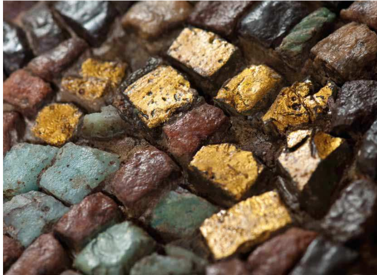
Particolare di una pavimentazione a mosaico

Un antico nome di città sulla cui etimologia fin quasi dal principio non c'è stata concordanza di vedute è Aquileia , al di là della sua apparente "trasparenza" ( aqua o aquila ). [...]