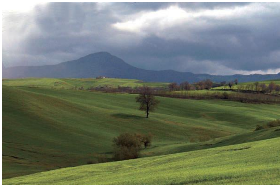
Valle di Vitalba

Il testo di J. L. A. Huillard Breholles, Historia diplomatica Friderici secundi , Paris 1852-1862, è una fonte di informazioni sull'allevamento dei cavalli. Esso veniva praticato su grandi spazi erbosi e nei boschi della Basilicata e nella Valle di Vitalba che, in una antica descrizione del 1231 riportata da F. Tichy, Die Walder der Basilicata und die Entwaldung , im.19 Jharhundert, Heidelberg, Munchen, 1962, erano compresi tra il monte Milievensis oltre il Trepis (Fiumara di Atella), Siricum (Monte Sirico), Cilliam (Toppo Cillis) con gli antichi centri di Caldaie (San Cataldo) e Armigeri (Armaterra) proseguiva per la sorgente Aqua saleria (Pietra del Sale) oltre il Montem de Anglona (Monte Carmine ?) verso Sacti Angeli (Sant'Angelo) e Sacti Nicolai de Castania (S. Nicola) nei territori di Casalis Asperis e Montis Marconi "proceduntur de serra ad seram supra Casalis Rivinegri (Rionero in Vulture) per viam Montis Milievensis ".