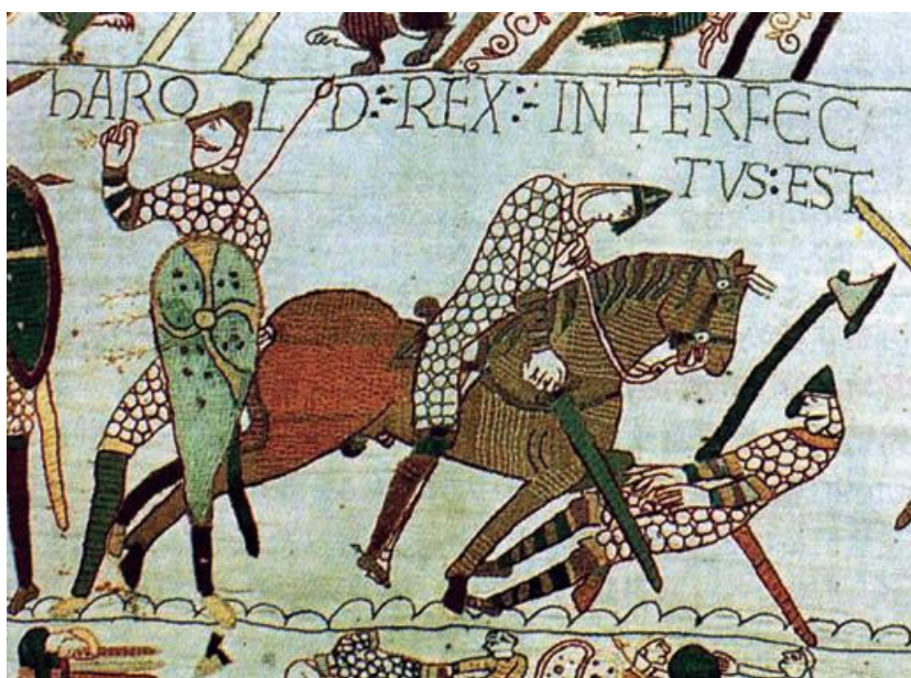
Cavalieri normanni in battaglia

Il termine arattia risale al francese antico haraz , che indicava l'allevamento dei cavalli formato dalla mandria di giumente e di stalloni destinati alla riproduzione e alle cavalcature. Il termine francese giunse nell'Italia meridionale con i Normanni, ma solo nel periodo svevo venne sostituito con il termine arattia , che indicava l'allevamento e l'insieme delle attività ad esso connesse, quali l'allevamento brado e