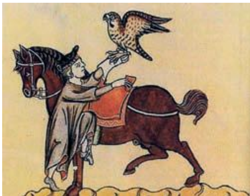
Cavallo per falconeria, Dal De arte venandi cum avibus

Furono forse proprio di Giordano Ruffo le descrizioni del cavallo ideale, adatto alla caccia con il falcone, riportate nel trattato « De arte venandi cum avibus ». Di grande interesse furono anche le opere di Bartolomeo da Messina, Mosè da Palermo, Bonifazio da Gerace e le opere successive di Lorenzo Rusio e Pietro dei Crescenzi, che diedero all'allevamento equino il carattere di vera e propria scienza.